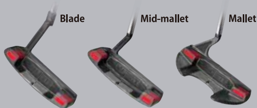
…高比重タングステン