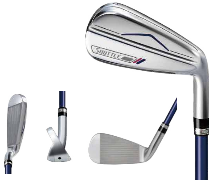
シャトル レディース ドライバー ロフト: 12.5° / フレックス: A/L シャトル レディース アイアン カーボン: 5~9, PW, AW, SW / フレックス: A/L

従来のアイアンではアプローチが難しかった女性におすすめな、デュアルバンス搭載の新設計アイアン。