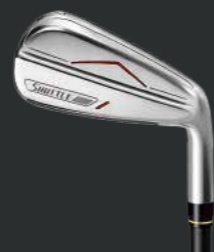
IMPACT FIT m230