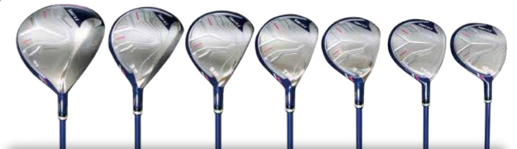
LADIES' WOOD LINEUP